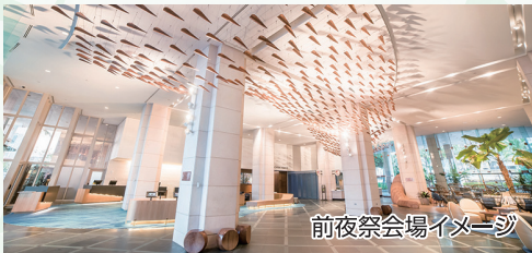
前夜祭会場イメージ